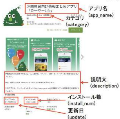
図 1 アプリストアのデータの例