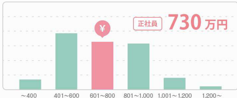
データサイエンティストの平均年収

Data scientist (biasanya kalo pinah kerja)